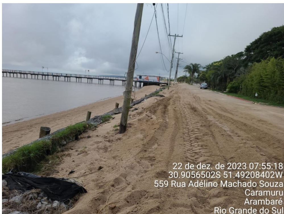
Figura 10: Foto mostra o final dos gabiões