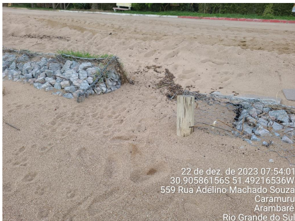
Figura 7: Foto mostra o comprometimento da estrutura