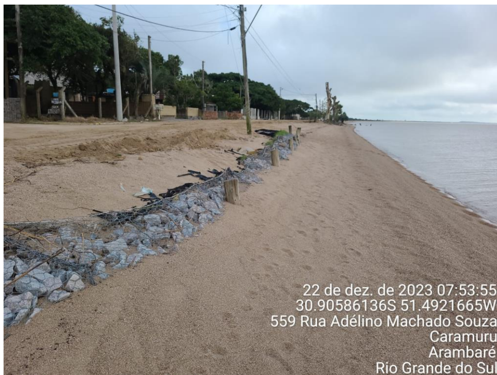
Figura 5: Vista dos gabiões ao logo da orla da praia

Nas imagens a seguir, observamos o comprometimento da estrutura dos gabiões com recalque acentuado, desmoronamento do aterro e destruição do calçamento executado com blocos intertravados de concreto da Rua Adelinno Machado de Souza.