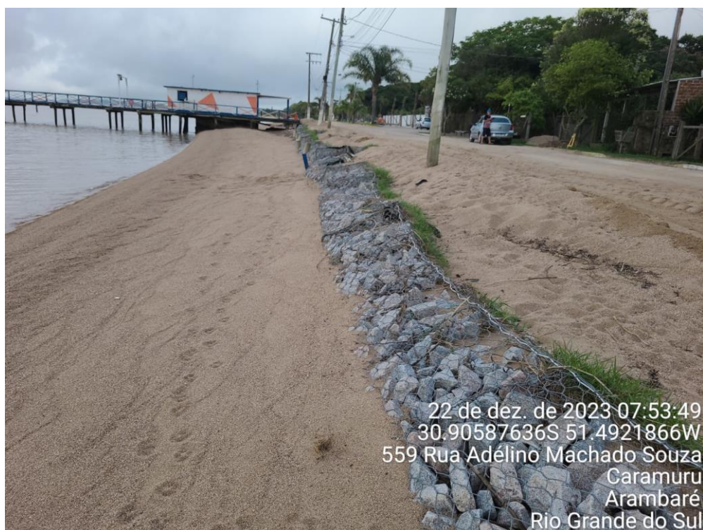
Figura 9:Foto mostra os gabiões na parte final