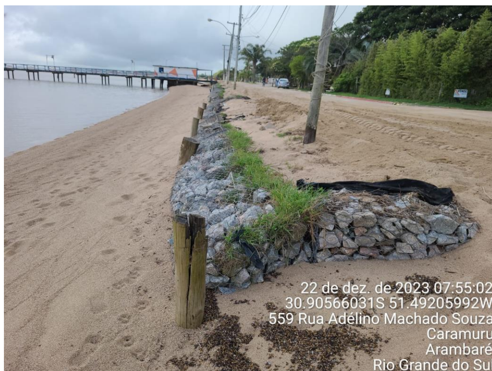
Figura 11: Ponto final dos Gabiões - foto georreferenciada