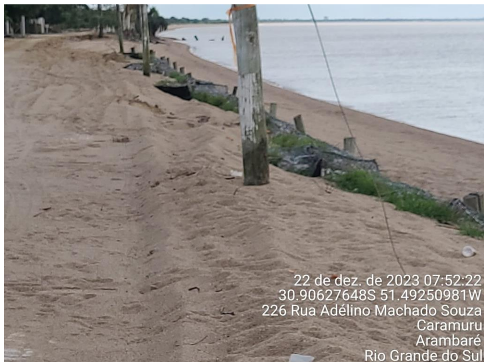
Figura 8: Foto mostra os gabiões com visão para Lagoa dos Patos