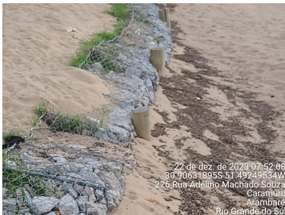
Figura 6: Vista dos gabiões